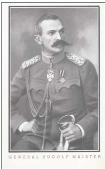
General Rudolf Maister – portret s sabljo.

V več kot desetih letih službovanja v Ljubljani je na vajah v premikanju vojske premeril slovensko ozemlje in se tako dodobra seznanil z ozemljem, kjer so živeli Slovenci. Neposredno spoznavanje terenov na Štajerskem in Koroškem mu je ob koncu prve svetovne vojne prišlo še kako prav. To je bilo tudi obdobje, ko je izdal pesniško zbirko Poezije, ko si je začel ustvarjati bogato knjižnico in ko je kot talentiran slikar začel tudi slikati.